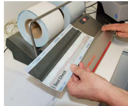
Abb. 3: Durchführung des Seal Check

Moderne Siegelgeräte unabhängige Etikettier- und Dokumentationssysteme wie das neue VeriDoc® kommen völlig ohne Computer aus und können diesen Anforderungen problemlos und kostengünstig nachkommen (Abb.1). Mittels so genannten „Scanlisten“ werden die Bezeichnungen der Instrumente oder Sets sowie die zugehörige Chargenkennzeichnung des folgenden Sterilisationsprozesses und der Name oder die ID des Verpackers eingelesen. Nach erfolgter Sichtprüfung des verpackten Produktes wird ein „Freigabebarcodes“ gescannt worauf das Etikett mit allen relevanten Angaben ausgedruckt wird. Nach erfolgter Sterilisation, Lagerung und Verwendung, kann das Etikett von der Ver-