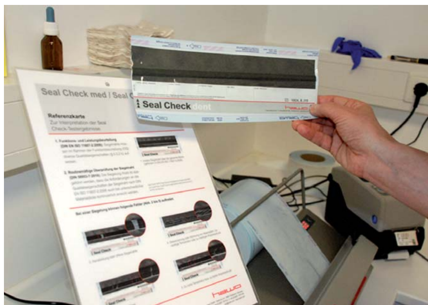
Abb. 4: Seal Check Auswertung

© IWB Consulting Iris Wälter-Bergob Hoppegarten 56, 59882 Meschede Tel.: 0174 310 29 96 www.iwb-consulting.info