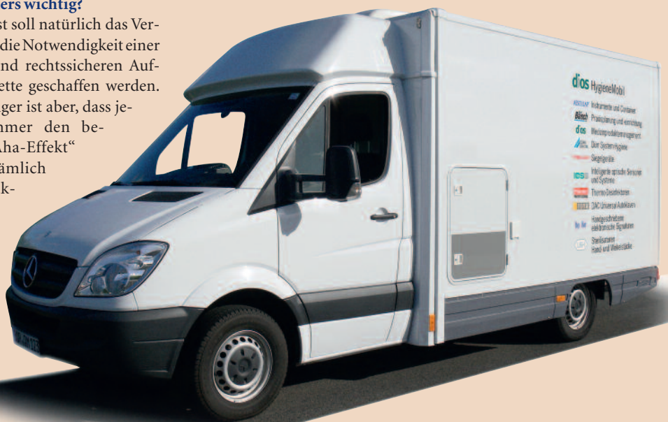
Abb.: Das Hygienemobil mit integriertem Aufbereitungsraum ist Teil der neuen Seminarreihe „Weiterbildung und Qualifizierung Hygienebeauftragte/-r für die Zahnarztpraxis“.

Vermittelt werden zum einen sämtliche theoretische Grundlagen zum Bereich Hygiene. Das Besondere aber ist, dass eine direkte praktische Umsetzung der theoretischen Bausteine im Hygienemobil stattfindet. So kann das Erlernte fast spielerisch vertieft werden. Die Teilnehmer bekommen einen noch besseren Zugang zur Thematik und den