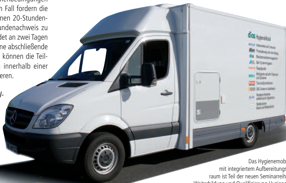
Das Hygienemobil mit integriertem Aufbereitungsraum ist Teil der neuen Seminarreihe „Weiterbildung und Qualifizierung Hygienebeauftragte/-r für die Zahnarztpraxis“

In unserem Hygienemobil ist ein vollständiger Aufbereitungsraum eingerichtet. Die Teilnehmer können sehen, dass es auch auf kleinstem Raum möglich ist, die Vorschriften der Hygienekette mit allen Gerätschaften und benötigten Utensilien